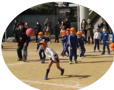
ドッジボール大会