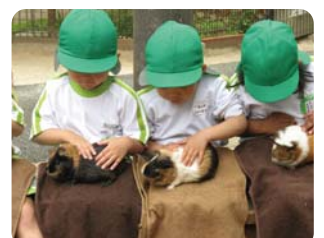
年中組 元淵江公園遠足