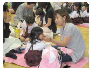
年少組 お楽しみ参観